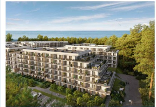
LOKAL NR A47