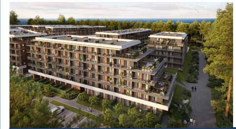
LOKAL NR A19