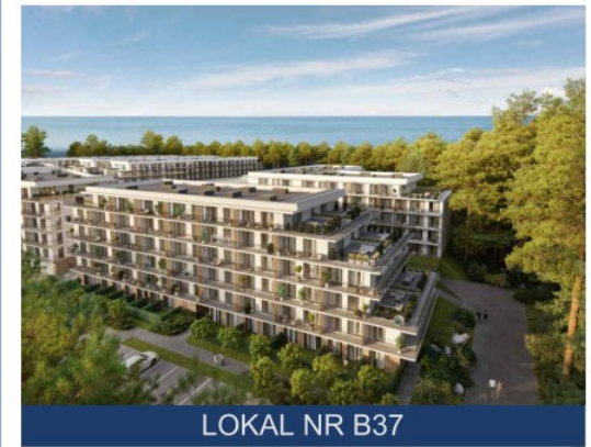
LOKAL NR B37