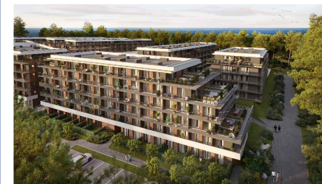
LOKAL NR C58