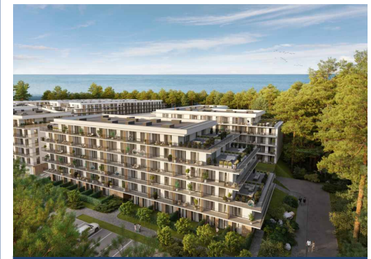
LOKAL NR A42